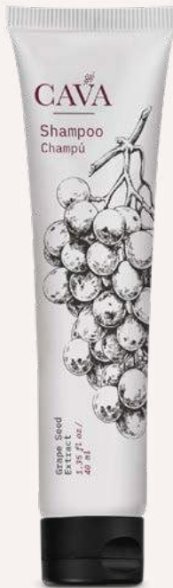
Shampoo 40ml Cod. 4052-L17 Caja con 150pzas.