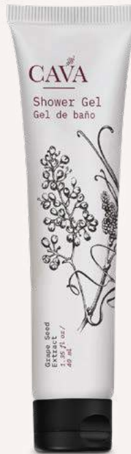
Gel de baño 40ml Cod. 4052-L19 Caja con 150pzas.