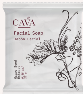
Jabón facial 25g Cod. 4052-I03 Caja con 300pzas.

nOcean™ Tubos envasados con plástico nOcean.