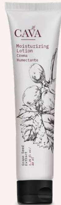
Crema humectante 40ml Cod. 4052-L20 Caja con 150pzas.

nOcean™ Tubos envasados con plástico nOcean.