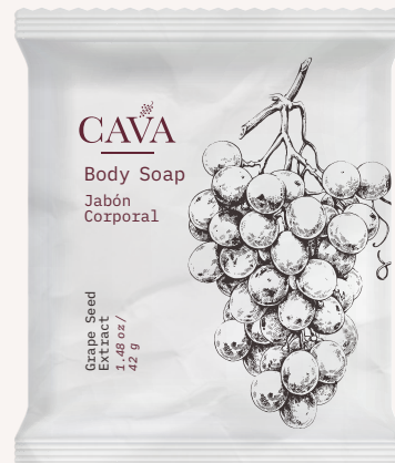
Jabón corporal 42g Cod. 4052-I04 Caja con 300pzas.