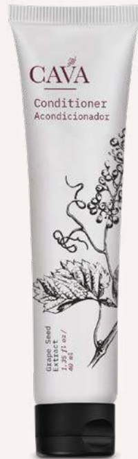
Acondicionador 40ml Cod. 4052-L18 Caja con 150pzas.